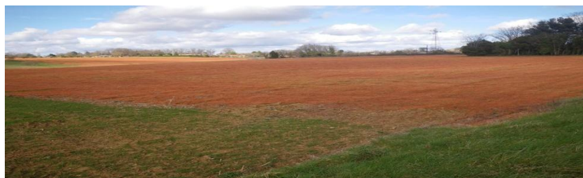
Champ traité aux herbicides

une légère augmentation de l'ensemble des autres herbicides (+ 2,7 %, 396 tonnes). Le glyphosate pèse pour 40,4 % de l'ensemble de ces 87 herbicides, contre 35,5 % en 2023. La catégorie « Autre » y est marginale, ne comprenant que 7 substances totalisant 4,4 tonnes.